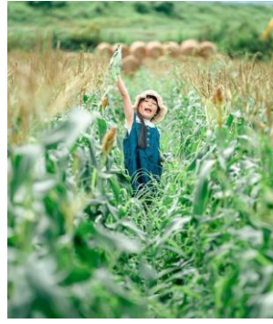
「ママとれたー！！」 福岡県 | @hobby_act