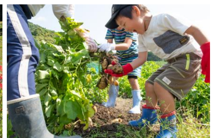
「大きなお芋に大はしゃぎ」 静岡県 | 斗星