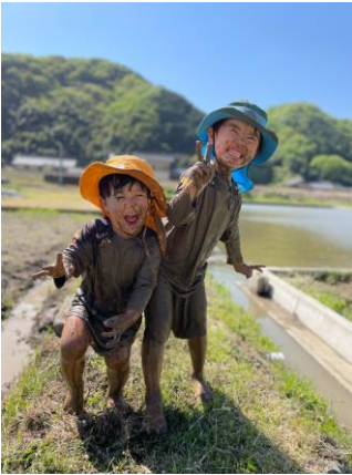
「わが家の田んぼ開き」 兵庫県 | はるそう