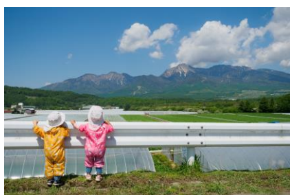
「身近にある農の景色」 長野県 | すいか