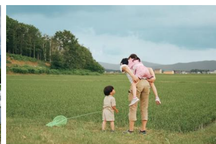
「ぱぱ！虫とりにいこーよ！」 北海道 | @non.photo.as