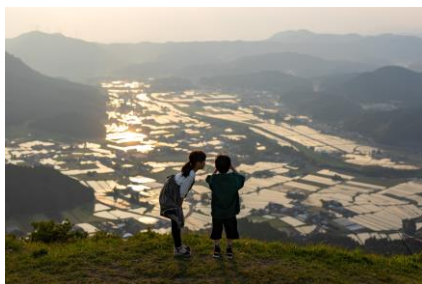
「光輝く町」 大分県 | erika