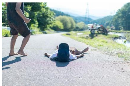
「休憩中」 東京都 | @mai.blume