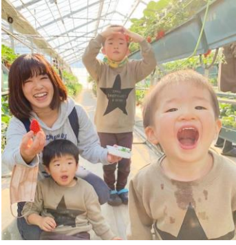
「みんなでいちご狩り！」 埼玉県 | @sesoyu3mama