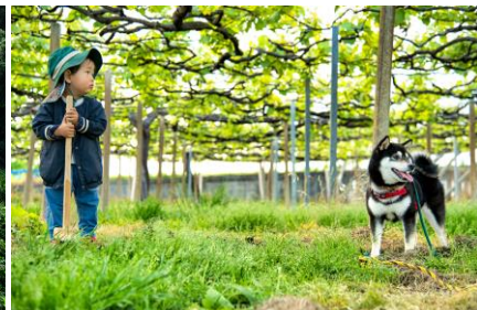
「一休」 山梨県 | @mige_higa