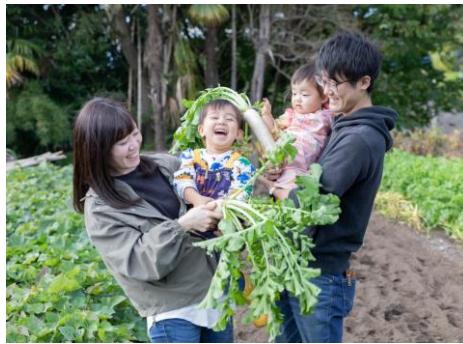
「家族で収穫」 静岡県 | 珠のパパ