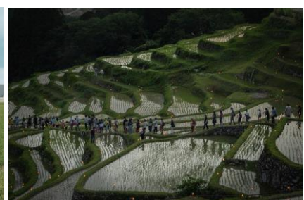
「虫送りの大行列」 愛知県 | ことママ