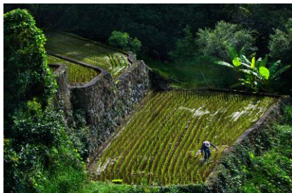
「石垣の村」 福岡県