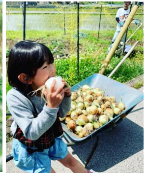
「初収穫」 広島県 | @823.aykhka